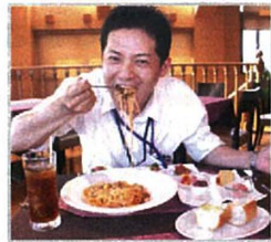
こんなミートソース初めて♪

の中から1品選べます。今回選んだミートソースパスタのソースは6時間もかけて作られており、パスタとの絡みが抜群!!ぺろりと食べてしまいました。また、前菜の中にある生ハムは世界三大生ハムの1つ「パルマの生ハム」で、2年熟成させた食材を使用してるそうです。塩分濃度が控えめなのにコクのある味を楽しむことが出来ました。