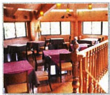
木のぬくもりある店内

今回のレポートは、イタリア料理店の「サンタ・ルーチェ」さんです。店内はテーブル席が13席、その内2席(8名程度)は個室にもなります！外観・内装ともにお城のイメージで、とても落ち着いた雰囲気でした。店名は木のぬくもりある店内「聖なる光」という意味で「太陽の光や植物の緑など、自然を感じながら食事を楽しんでもらいたい…心も体も元気になってもらいたい」という想いが込められています。